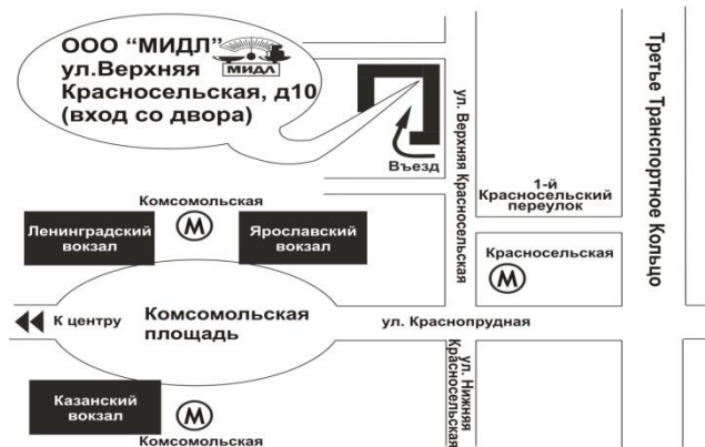
Схема проезда к офису фирмы “МИДЛ”

Филиал ООО «МИДЛ» тел/факс (499) 264-57-65, 264-57-43